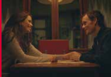
PORTO (PT/US/FR/PL 2016)