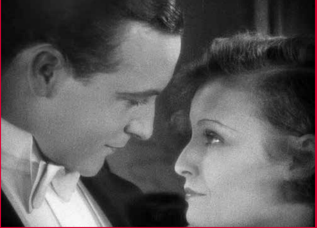
IHR DUNKLER PUNKT (DE 1928)

Murnaustraße 6 | 65189 Wiesbaden | gegenüber Kulturzentrum Schlachthof