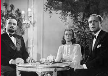
KRIMINALKOMMISSAR EYCK (DE 1940)