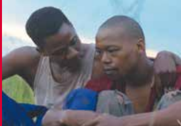
DIE WUNDE (ZA/DE/FR/NL 2017)