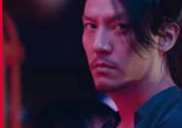
MR. LONG (JP/TW/HK 2017)