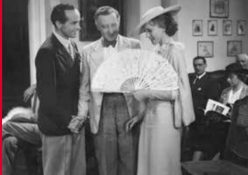
LADY WINDERMERES FÄCHER (DE 1935)

die Berufserlaubnis. Ab 1948 führte sie ihre erfolgreiche Karriere als Journalistin, Theaterproduzentin und Dozentin in den USA fort, blieb aber auch als Schauspielerin aktiv. In ihrem Debüt, dem Artisten-Melodram MANEGE , wurde sie gleich in der weiblichen Hauptrolle besetzt.