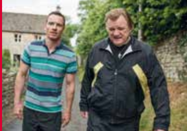
DAS GESETZ DER FAMILIE (US 2016)