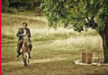
ON THE MILKY ROAD (RS/GB/US 2017)