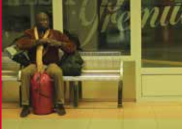
ALS PAUL ÜBER DAS MEER KAM (DE 2017)