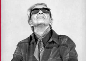
CHAVELA (US 2017)