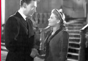
DER MAJORATSHERR (DE 1944)