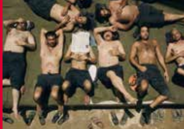
GELOBT SEI DER KLEINE BETRÜGER (JO/DE/NL 2016)