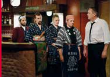
DIE ANDERE SEITE DER HOFFNUNG (FI 2017)