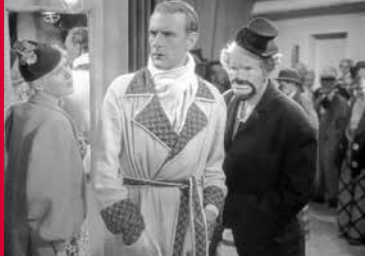
MANEGE (DE 1937)