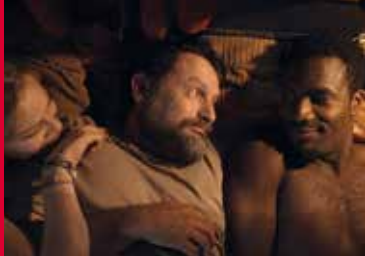
LUCKY LOSER – EIN SOMMER IN DER BREDOUILLE (DE 2017)