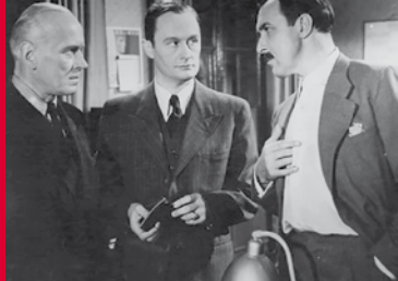
DIE NACHT DER ZWÖLF (DE 1944/48)

as, einer traditionellen, normalerweise für Männer komponierten, mexikanischen Musikgattung. Über die offen lesbische Sängerin mit der rauchigen Stimme existieren zahllose Legenden, welche in diesem Porträt ebenso aufgegriffen werden wie etwa ihre Funktion als Muse für Pedro Almodóvar.