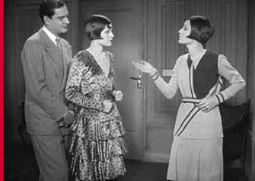
IHR DUNKLER PUNKT (DE 1928)