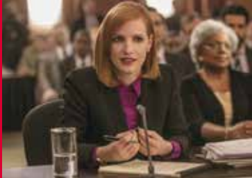
DIE ERFINDUNG DER WAHRHEIT (US/FR 2017)