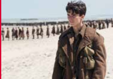
DUNKIRK (US/FR/GB/NL 2017)