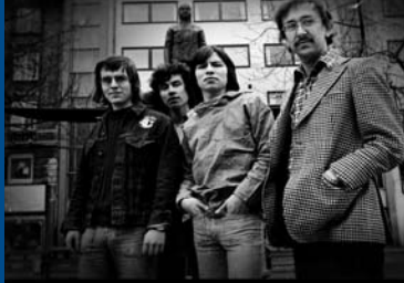
SUMÉ – THE SOUND OF A REVOLUTION (GL/DK/NOR 2014)