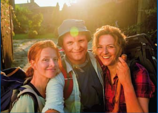
ICH BIN DANN MAL WEG (DE 2015)

Murnastraße 6 | 65189 Wiesbaden | gegenüber Kulturzentrum Schlachthof