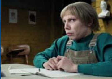
DER BUNKER (DE 2015)

Das in Ungarn spielende Liebesdrama gilt als der erste deutsche komplett vertonte Spielfilm und den ersten Satz spricht Willy Fritsch: „Ich spare nämlich auf ein Pferd.“ Dieser spielt den mittellosen Soldaten János Garas, der mit einem Pferd später ein Transportgeschäft gründen will. Er verliebt sich in die Dienstmagd Julia Balog. Doch als Julia ihre Stellung verliert, gerät sie in die Fänge der skrupellosen Zimmervermittlerin Czibulka, welche die junge Frau an ein Bordell vermittelt. Als János Julia dort erblickt, nimmt die Tragödie ihren Lauf.