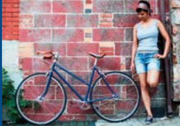
INTERNATIONALES FESTIVAL DES FAHRRAD-FILMS IN WIESBADEN