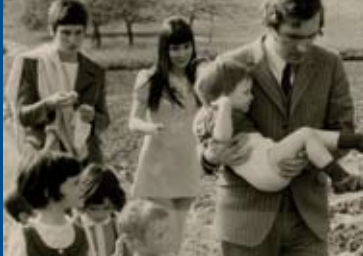
MEIN VATER, SEIN VATER UND ICH (DE 2013-15)