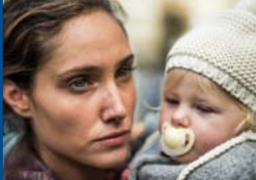
EIN ATEM (DE/GR 2015)