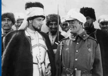
DER WEISSE TEUFEL (DE 1930)

der Fahrradkultur. Die Programmkommission hat aus zahllosen Film-Einsendungen die 18 besten ausgesucht: von gezeichneter Systemkritik aus Mallorca über das Porträt eines Fahrradmechanikers aus Amsterdam bis zu jungen Mädchen, die Fixies bauen und fahren. Garantiert beste Unterhaltung!