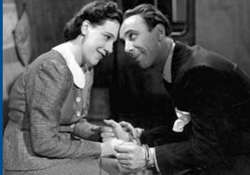
ZWÖLF MINUTEN NACH ZWÖLF (DE 1939)