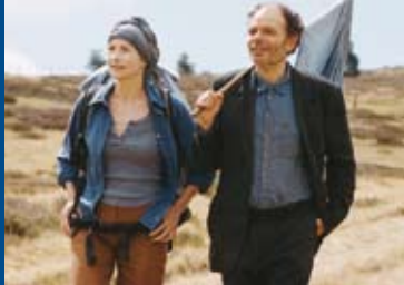
St. JACQUES... PILGERN AUF FRANZÖSISCH (FR 2005)