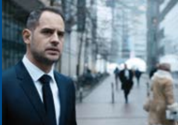
DIE DUNKLE SEITE DES MONDES (DE/LUX 2015)