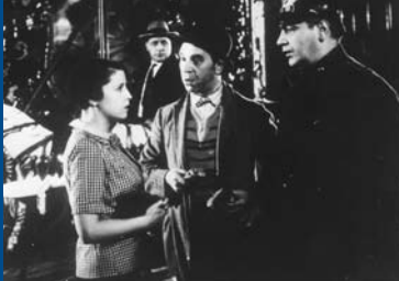
WER NIMMT DIE LIEBE ERNST? (DE 1931)

„Wo komme ich her, wo gehe ich hin: Selten ist darüber derart sensibel nachgedacht worden [...]. Das hat bis jetzt in dieser Genauigkeit noch kein anderer Film beschrieben.“ (SWR 2 Kultur)