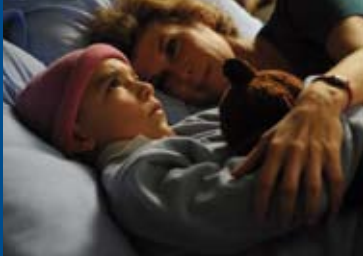
OSKAR UND DIE DAME IN ROSA (FR/BE 2009)