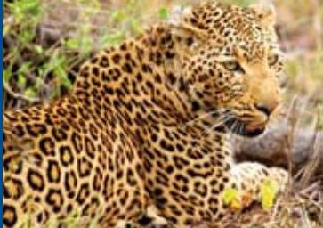
SÜDAFRIKA – DER KINOFILM (DE 2015)