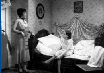
EIN HOCHZEITSTRAUM (DE 1936)