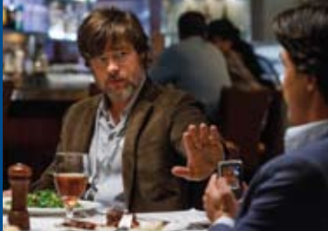
THE BIG SHORT (USA 2015)