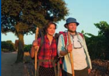
ICH BIN DANN MAL WEG (DE 2015)