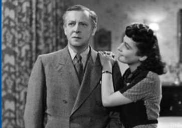
KLEINE MÄDCHEN – GROSSE SORGEN (DE 1941)