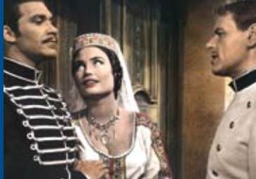
HELDEN (DE 1958)