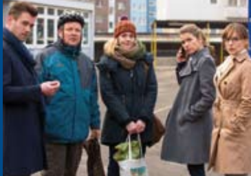
FRAU MÜLLER MUSS WEG (DE 2015)