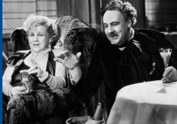
FREUT EUCH DES LEBENS (DE 1934)