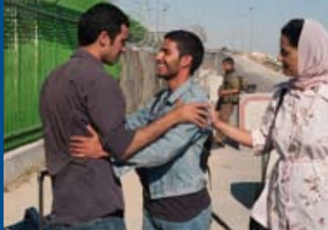
DER SOHN DER ANDEREN (FR 2012)