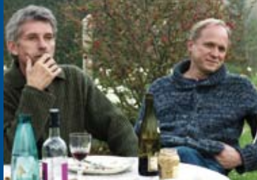
WOCHENENDEN IN DER NORMANDIE (FR 2014)

FREITAG, DER 13. kam vor dem Ende des Zweiten Weltkriegs nicht mehr in die Kinos, sondern erst im November 1949 in der BRD.