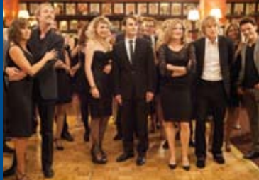
BROADWAY THERAPY (USA 2014)