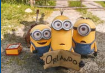
MINIONS 3D (USA 2015)