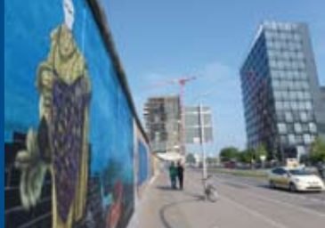
ICH & KAMINSKI (DE/BE 2015)