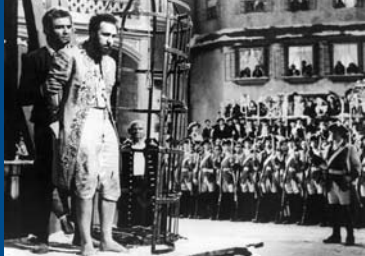
Jud Süß (DE 1940)