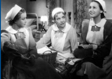
IRRNUM DES HERZENS (DE 1939)