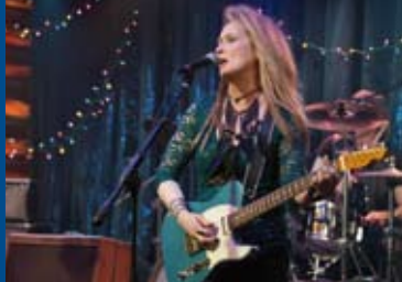
RICKI – WIE FAMILIE SO IST (USA 2015)

Musikalische Komödie um eine Revue-Tänzerin, die trotz vieler Intrigen ihr berufliches und privates Glück findet. Marika Röck und Johannes Heesters galten als das Traumpaar des Revuefilms schlechthin.