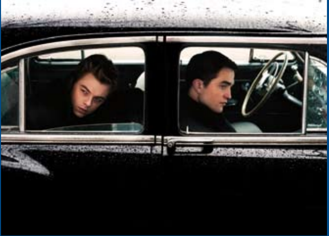
LIFE (CAN/DE/AU 2014)

Murnaustraße 6 | 65189 Wiesbaden | gegenüber Kulturzentrum Schlachthof