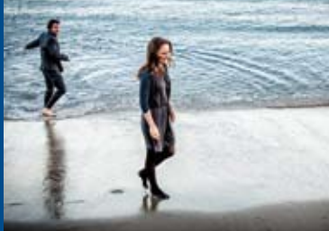
KNIGHT OF CUPS (USA 2015)