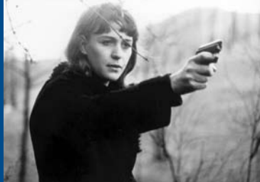
ABSCHIED VON GESTERN (DE 1965/66)