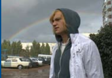
CHILDREN 404 (RUS 2014)