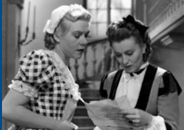
DAS FRÄULEIN VON BARNHELM (DE 1940)