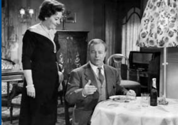
DER JUGENDRICHTER (DE 1960)