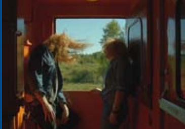
STATION TO STATION (USA 2015)