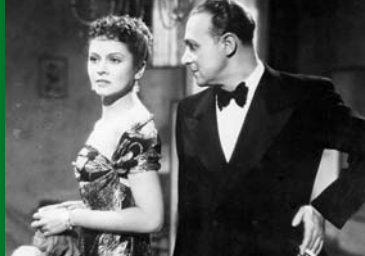
MÄNNER MÜSSEN SO SEIN (DE 1939)