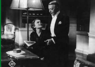
DER FALL DERUGA (DE 1938)