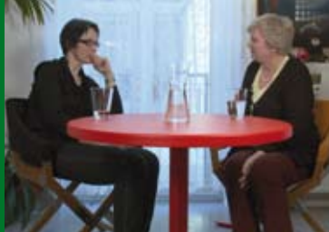
KOPF HERZ TISCH (DE 2014/15)