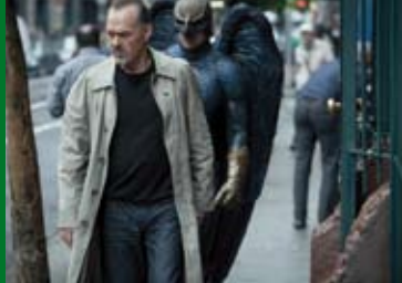
BIRDMAN (USA 2014)