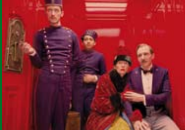
GRAND BUDAPEST HOTEL (USA/DE 2013)