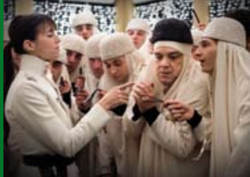
JACKY IM KÖNIGREICH DER FRAUEN (FR 2014)

phan Bergmann begleitete den 74jährigen und andere Gentle- men, die, ebenso wie die amüsierfreudigen Frauen, erfrischend ehrlich und direkt über ihr Leben und ihre Sehnsüchte erzählen. Eine lebensbejahende Dokumentation über das Älterwerden.