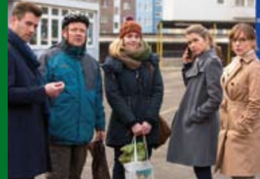
FRAU MÜLLER MUSS WEG (DE 2014/15)