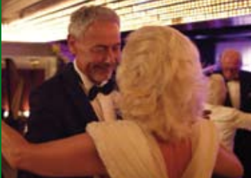
DIE LETZTEN GIGOLOS (DE 2014)