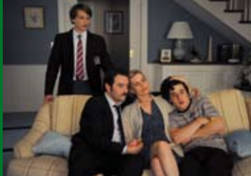
IN IHREM HAUS (FR 2012)