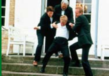
DAS FEST (DK 1998)