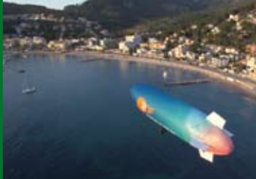
ABENTEUER MALLORCA (DE 2013)