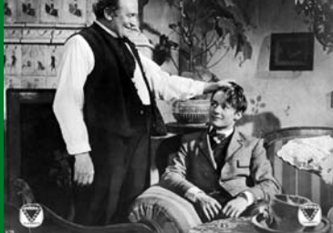
JUGEND (DE 1937/38)