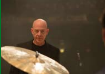
WHIPLASH (USA 2014)