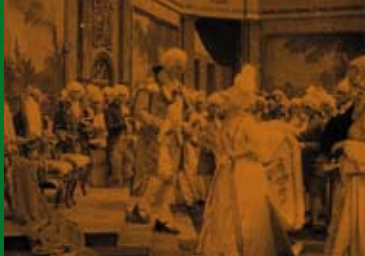
MADAME DUBARRY (DE 1919)