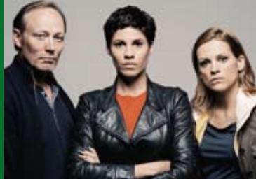
THE TEAM (Folge 1) (DE 2015)

Rollenbilder und Geschlechterklischees völlig auf den Kopf. In der fiktiven Volksrepublik Bubunne führen die Frauen ein hartes Regiment. Männer hingegen sollen vor allem eines: hübsch aussehen. Vollverschleierung in der Öffentlichkeit und Erledigung des Haushalts sind Pflicht, sexuelle Bereitschaft selbstverständlich.