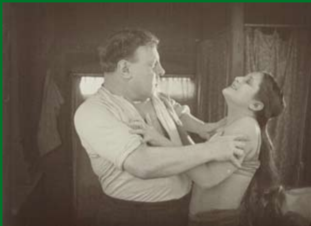
VARIÉTÉ (DE 1925)

Murnaustraße 6 | 65189 Wiesbaden | gegenüber Kulturzentrum Schlachthof