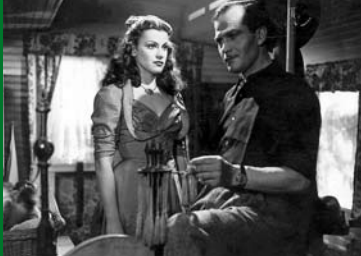
TROMBA (DE 1949)