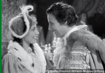
DER BETTELSTUDENT (DE 1936)