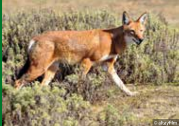
MEGETI – AFRICA'S LOST WOLF (DE 2016)