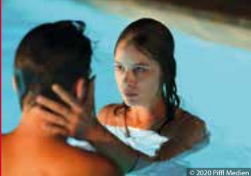
CORPUS CHRISTI (PL/FR 2019)