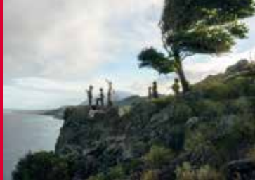
WENDY (US 2020)