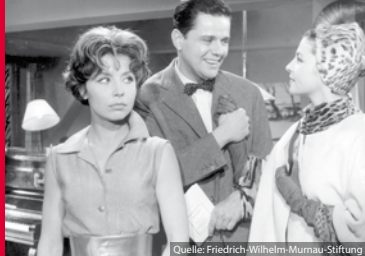
LIEBE AUF KRUMMEN BEINEN (DE 1959)

der USA es auch bleibt. Aus dem lokalen Konflikt zwischen Demokraten und Republikanern entflammt ein Kampf um die Seele Amerikas.