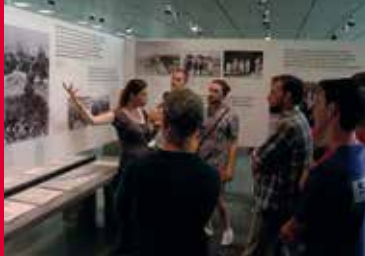
NACHLASS – PASSAGEN (DE 2019)