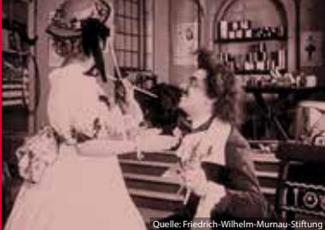
DIE PUPPE (DE 1919)