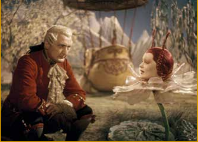
MÜNCHHAUSEN (DE 1943)

Murnaustraße 6 | 65189 Wiesbaden | gegenüber Kulturzentrum Schlachthof