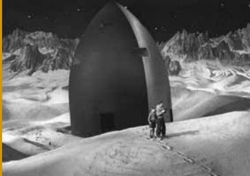
FRAU IM MOND (DE 1929)