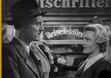
DER VERZAUBERTE TAG (DE 1943)