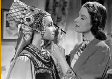
DER VORHANG FÄLLT (DE 1939)