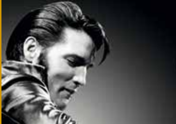
ELVIS: '68 COMEBACK SPECIAL (US 1968/2018)