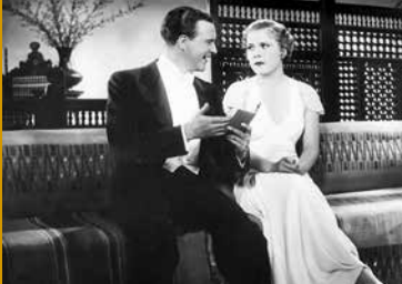
SAISON IN KAIRO (DE 1933)