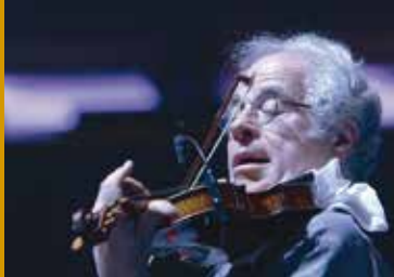
ITZHAK PERLMAN – EIN LEBEN FÜR DIE MUSIK (US/IL 2018)