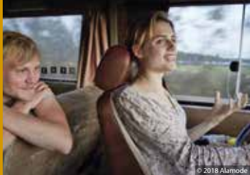
303 (DE 2018)