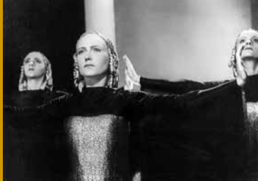
DAPHNE UND DER DIPLOMAT (DE 1937)