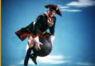
MÜNCHHAUSEN (DE 1943)