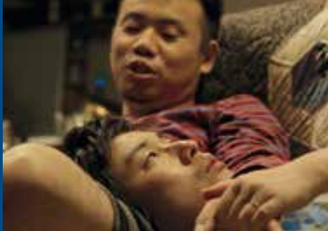
OF LOVE & LAW (JP/GB/FR 2017)