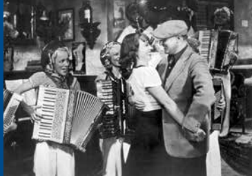
EIN MANN AUF ABWEGEN (DE 1940)

„Weniger ein typischer Genre-Film als eine meisterhaft inszenierte und gespielte Genre-Reflexion. Finster, brutal und poetisch.“ (epd-Film)