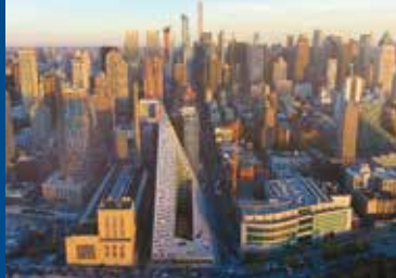
BIG TIME (DK 2017)