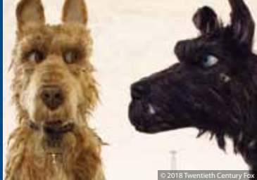
ISLE OF DOGS – ATARIS REISE (US/DE 2017)