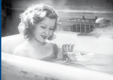
NIE WIEDER LIEBE! (DE 1931)