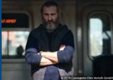
© 2018 Constantin Film Verleih GmbH