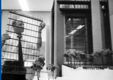
KEVIN ROCHE – DER STILLE ARCHITEKT (IE/FR/ES 2017)