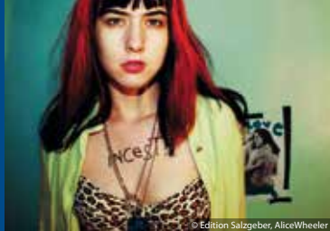
QUEERCORE – HOW TO PUNK A REVOLUTION (DE 2017)