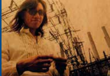
SEARCHING FOR SUGAR MAN (GB/SE 2012)