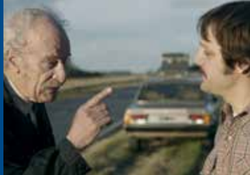
CAMINO A LA PAZ (AR 2016)