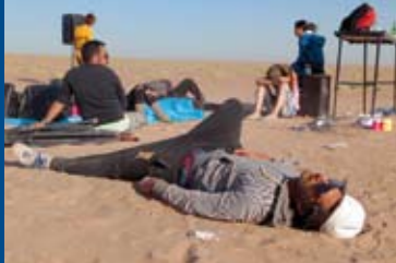
RAVING IRAN (CH 2016)