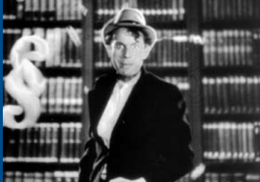
DER MANN, DEM MAN DEN NAMEN STAHL (DE 1944)