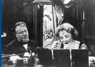
DER BLAUE ENGEL (DE 1930)