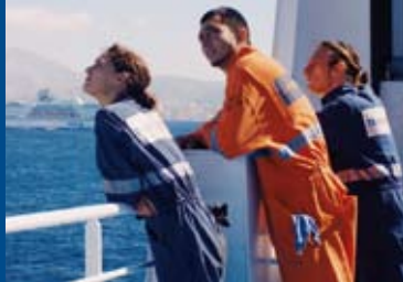
ALICE UND DAS MEER (FR 2014)