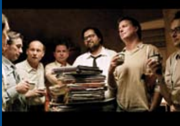
DAS GESTÄNDNIS (DE 2015)