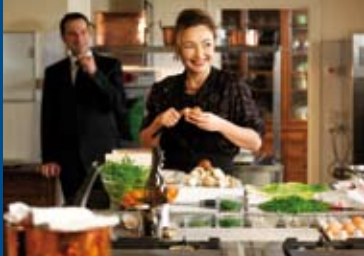
DIE KÖCHIN UND DER PRÄSIDENT (FR 2012)