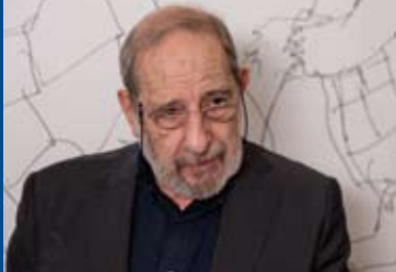
AUF EINE ZIGARETTE MIT ÁLVARO SIZA (DE 2016)