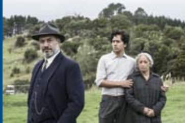
MAHANA – EINE MAORI-SAGA (NZ 2015)