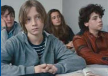
MIKRO & SPRIT (FR 2015)