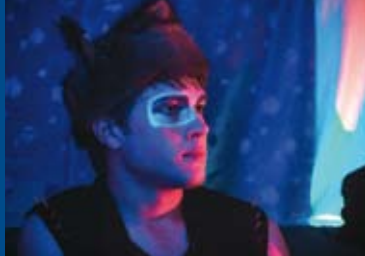
CLOSET MONSTER (CA 2015)

Einführung und Filmbesprechung: Horst Walther, MA (Institut für Kino und Filmkultur), Seminarteilnahme ab 14 Jahren Sondereintritt: 7€/6€ ermäßigt