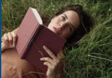
KOMMEN RÜHRGERÄTE IN DEN HIMMEL? (DE 2016)