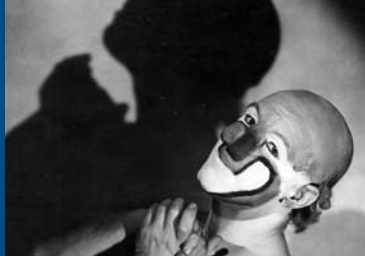
AKROBAT SCHÖ-Ö-Ö-N (DE 1943)