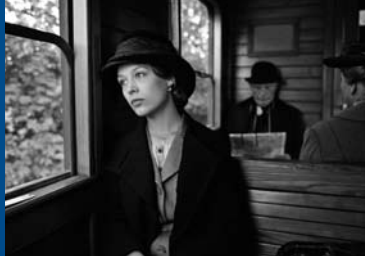
FRANTZ (FR/DE 2016)