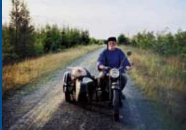
DIE LETZTE SAU (DE 2016)