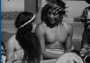
TABU (USA 1931)