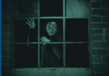
NOSFERATU – EINE SYMPHONIE DES GRAUENS (DE 1921)