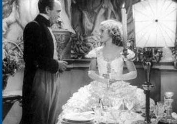
ICH UND DIE KAISERIN (DE 1933)

Ein fauler und korrupter Beamter aus der Landesverwaltung für Jagd und Fischerei wird vor die Wahl gestellt: Entlassung oder Versetzung. Er entscheidet sich für Zweites, ohne zu ahnen, dass er schließlich am Nordpol landen wird... In Italien ist die Bürokratie-Satire der erfolgreichste Film aller Zeiten!