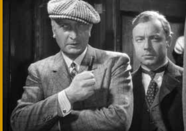
DER MANN, DER SHERLOCK HOLMES WAR (DE 1937)