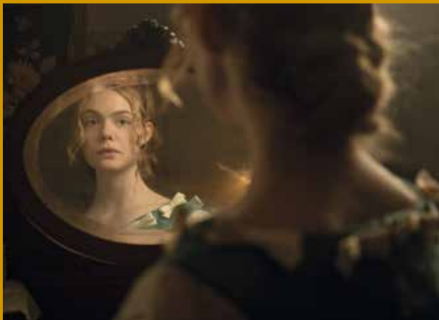
DIE VERFÜHRTEN (US 2017)

Murnaustraße 6 | 65189 Wiesbaden | gegenüber Kulturzentrum Schlachthof