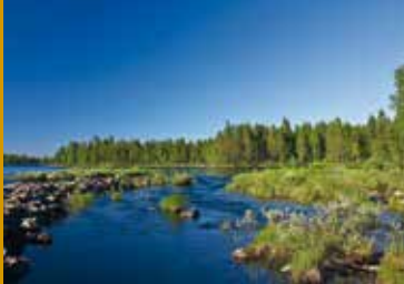
FINNLAND – WILDNIS UND MODERNE (DE 2015)