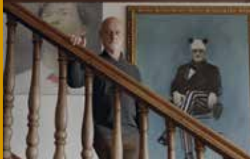
THE CHINESE LIVES OF ULI SIGG (CH 2016)