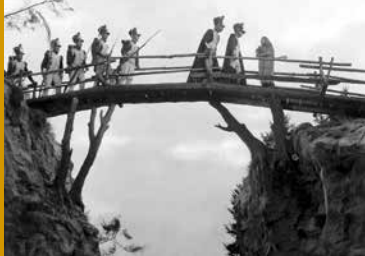
DER KATZENSTEG (DE 1937)