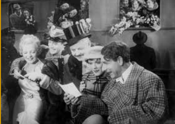
DIE CSARDASFÜRSTIN (DE 1934)

Wiesbadener Erstaufführung: Der Schweizer Uli Sigg hat in der Phase der wirtschaftlichen Öffnung Chinas nach der Mao-Zeit eine wesentliche Rolle gespielt und trug die bedeutendste Sammlung chinesischer Gegenwartskunst zusammen. Der größte Teil davon wird dem Museum M+ in Hong Kong übergeben, welches 2019 eröffnet wird. Eine Vielzahl chinesischer Künstler wie Ai Weiwei kommen in der Dokumentation zu Wort.