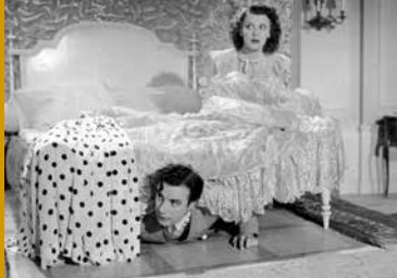
ES FING SO HARMLOS AN (DE 1943/44)