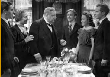
DIE DEGENHARDTS (DE 1944)

Kidman, Kirsten Dunst, Elle Fanning und Colin Farrell. Intelligentes, subtiles Arthouse-Kino.“ ( programmokino.de )