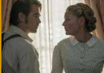
DIE VERFÜHRTEN (US 2017)