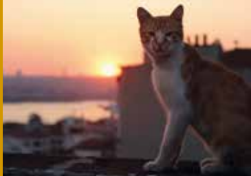
KEDI – VON KATZEN UND MENSCHEN (TR/US 2016)