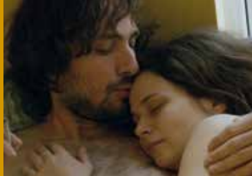
ANA, MON AMOUR (RO/DE/FR 2017)