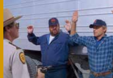
SIE NANNTEN IHN SPENCER (DE 2017)