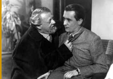
DER WUNDERBARE GARTEN DER BELLA BROWN (GB/US 2016)