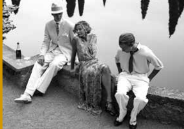
PARADIES (RU/DE 2016)