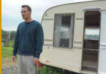
DAS GESETZ DER FAMILIE (US 2016)

gesehen werden. Einer der großen Ufa-Erfolge.“ ( Lexikon des internationalen Films )