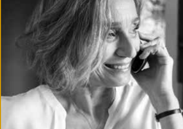
THE PARTY (GB 2017)