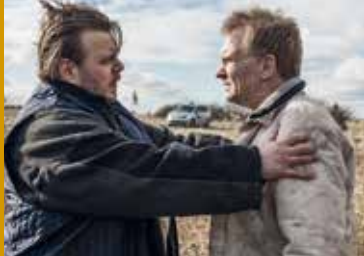
SMALL TOWN KILLERS (DK 2016)