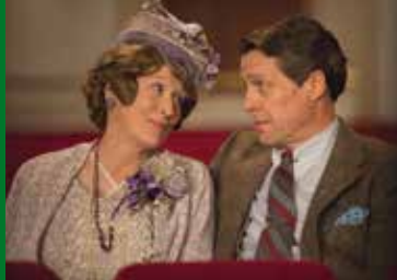
FLORENCE FOSTER JENKINS (GB/FR 2016)