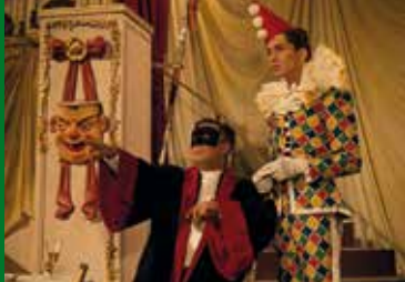
DIE FASTNACHTSBEICHTE (DE 1960)