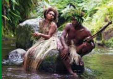
TANNA – EINE VERBOTENE LIEBE (AU 2015)