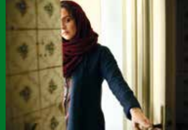
THE SALESMAN (IR/FR 2016)