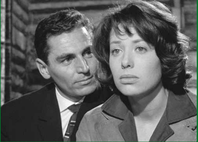
SCHWARZER KIES (DE 1961)

Murnaustraße 6 | 65189 Wiesbaden | gegenüber Kulturzentrum Schlachthof