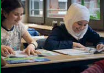
ALLES GUT (DE 2016)