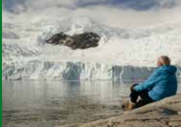
ZWISCHEN HIMMEL UND EIS (FR 2015)