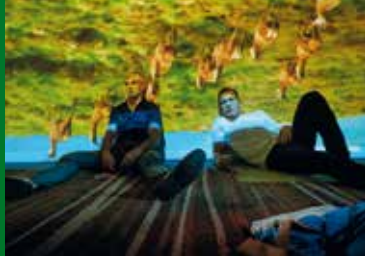
ORIGINAL COPY – VERRÜCKT NACH KINO (DE 2015)