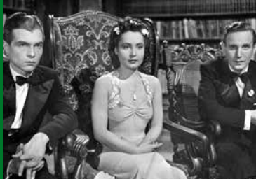
SOPHIENLUND (DE 1943)