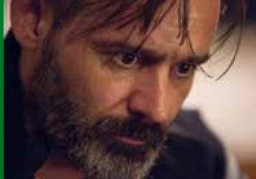
DER EID (IS 2016)