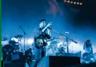
MUMFORD & SONS – LIVE FROM SOUTH AFRICA (GB 2016)