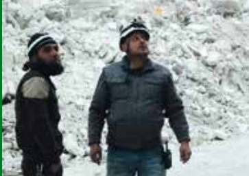
DIE LETZTEN MÄNNER VON ALEPPO (DK/SY 2017)