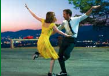
LA LA LAND (US 2016)