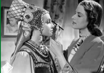
DER VORHANG FÄLLT (DE 1939)