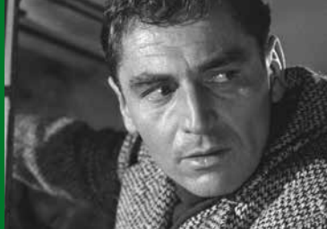
SCHWARZER KIES (DE 1961)