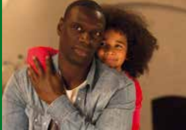
PLÖTZLICH PAPA (FR 2016)