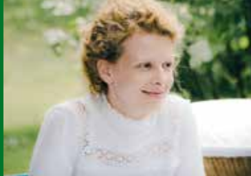
MARIE CURIE (DE/FR/PL 2016)