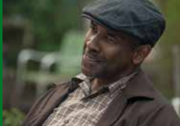
FENCES (US 2016)