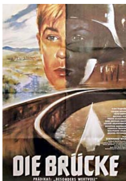
DIE BRÜCKE (Plakatarchiv)