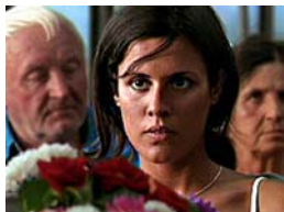
Kurzfilmpreis: DURCH DIE BLUME