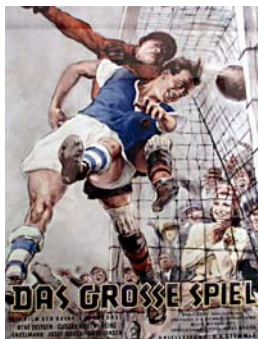
DAS GROSSE SPIEL (Plakatarchiv)