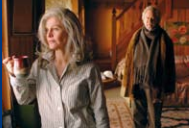
AN IHRER SEITE (CA/UK/USA 2006)