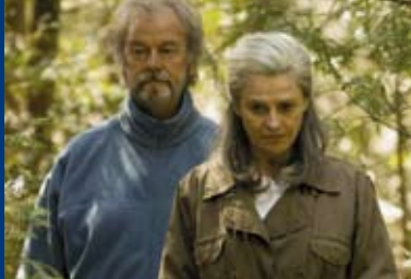
AN IHRER SEITE (CA/UK/USA 2006)