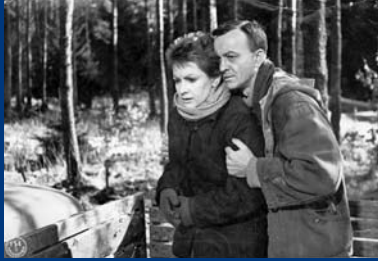
TAIGA (DE 1958)