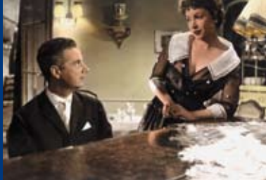
DIE IDEALE FRAU (DE 1959)