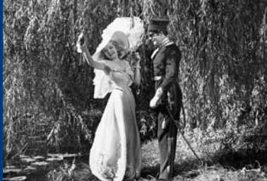
DAS HOFKONZERT (DE 1936)