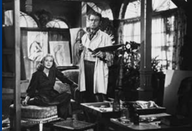
DIE SÜNDERIN (DE 1950)