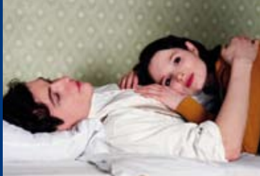
DAS BLAUE VOM HIMMEL (DE 2010/11)