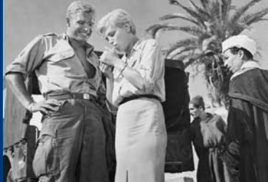
MADELEINE UND DER LEGIONÄR (DE 1957)