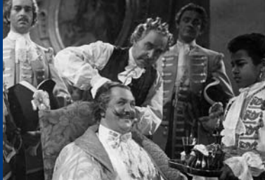
DER BETTELSTUDENT (DE 1936)