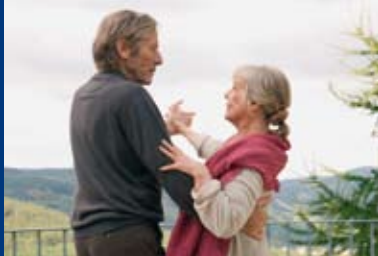
EINES TAGES... (DE 2009)