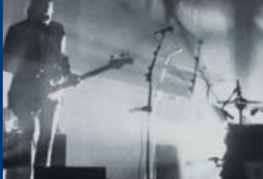
SIGUR ROS: INNI (USA 2011)