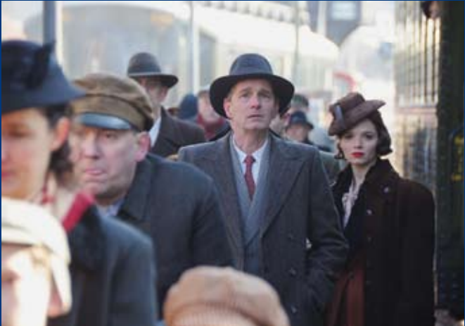
THE BALLAD OF GENESIS AND LADY JAYE (USA/FR 2011)

Murnastraße 6 | 65189 Wiesbaden | gegenüber Kulturzentrum Schlachthof