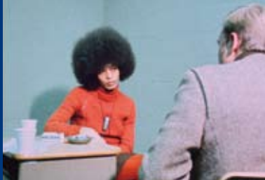
THE BLACK POWER MIXTAPE 1967-1975 (S 2011)