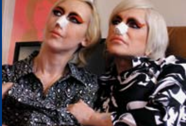
THE BALLAD OF GENESIS AND LADY JAYE (USA/FR 2011)