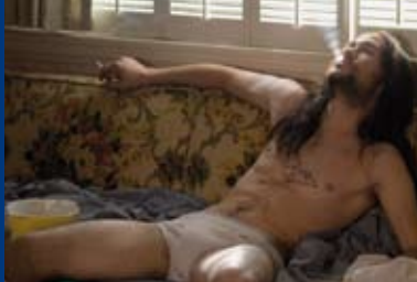
HESHER (USA 2010)