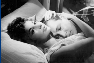
MENSCHEN IM NETZ (DE 1959)