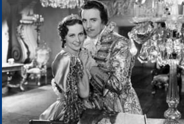
DER BETTELSTUDENT (DE 1936)