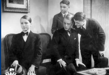
DER PAGE VOM DALMASSE-HOTEL (DE 1933)