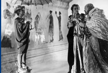
AMPHITRYON (DE 1935)