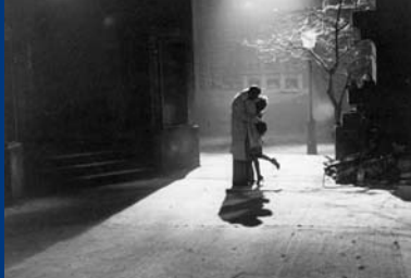
STRASSENBEKANNTSCHAFT (DDR 1948)