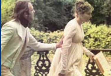
DIE MARQUISE VON O... (DE/FR 1975)