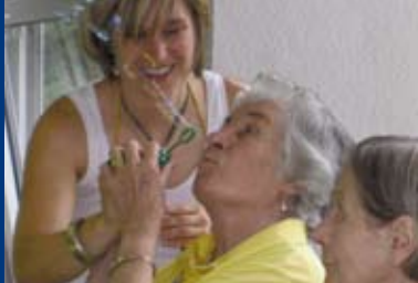
Lebenslust bei Demenz