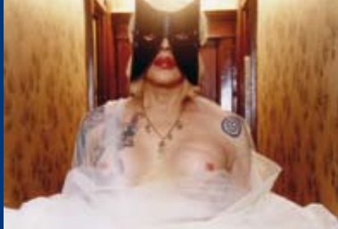
THE BALLAD OF GENESIS AND LADY JAYE (USA/FR 2011)