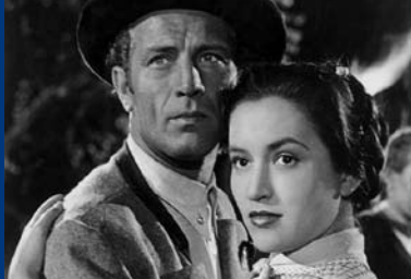
DIE SELTSAME GESCHICHTE DES BRANDNER KASPAR (DE 1949)