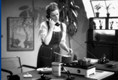
AUS EINS MACH' VIER (DE 1942)