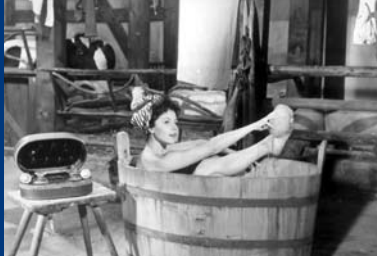
DAS BAD AUF DER TENNE (DE 1955)