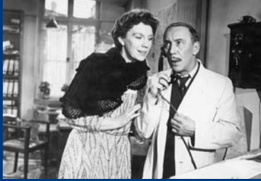
DIE SPANISCHE FLIEGE (DE 1954/55)