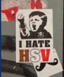
KIEZKICK UND PUNKROCK (DE 2011)