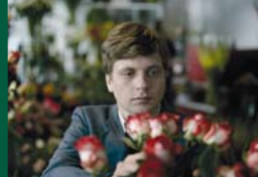
DER FREUND (CH 2008)