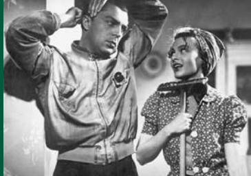
WIR MACHEN MUSIK (DE 1942)