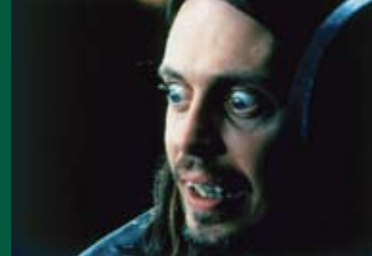
LIVING IN OBLIVION (USA 1995)