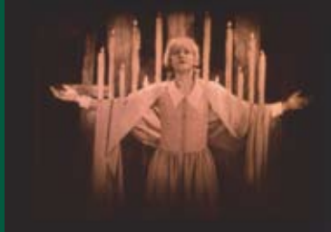
METROPOLIS (DE 1927, Bearbeitung USA 1984)