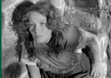
DER KATZENSTEG (DE 1937)