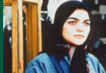
DER KREIS (Iran / IT 2000)