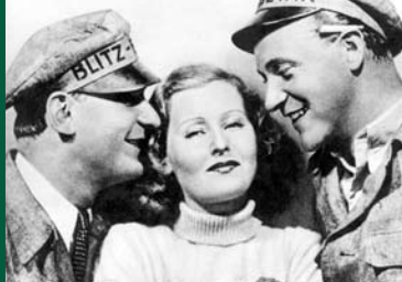
EIN BLONDER TRAUM (DE 1932)