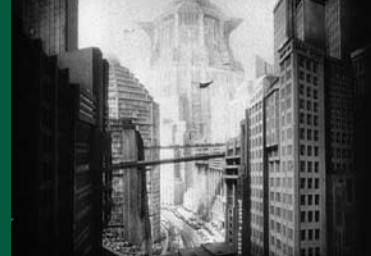
METROPOLIS (DE 1927, restaurierte Fassung von 2010)