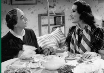
MULHOLLAND DRIVE - STRASSE DER FINSTERNIS (USA / F 2001) GELIEBTE WELT (DE 1942)