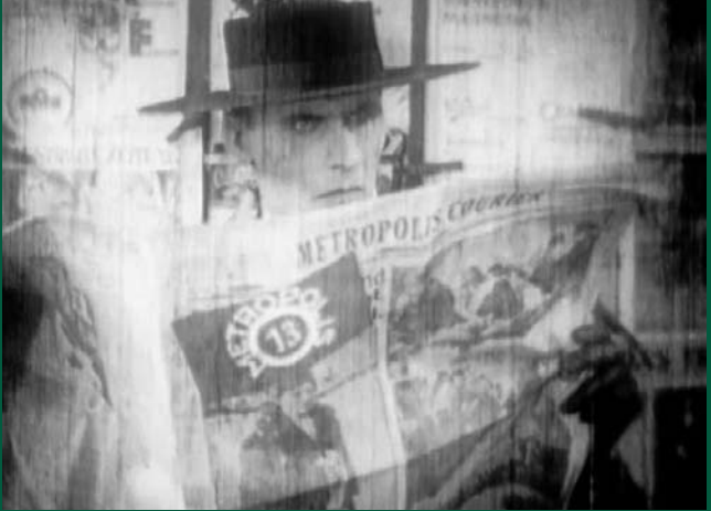
METROPOLIS (DE 1927, restaurierte Fassung von 2010)

Murnaustraße 6 | 65189 Wiesbaden | gegenüber Kulturzentrum Schlachthof