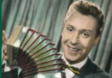
SCHLAF AUF SCHLAG (DE 1958)