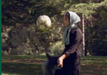
FOOTBALL UNDER COVER (DE 2008)