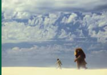
WO DIE WILDEN KERLE WOHNEN (USA 2008)