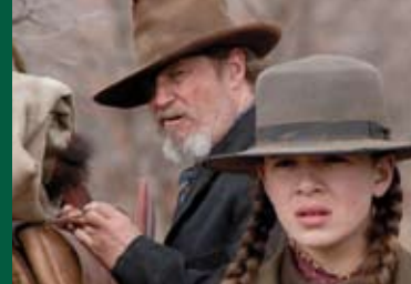
TRUE GRIT (USA 2010)