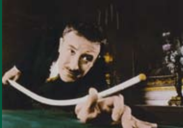
EIN SCHUSS IM DUNKELN (USA 1964)