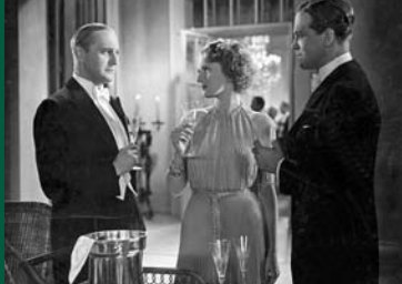
STADT ANATOL (DE 1936)