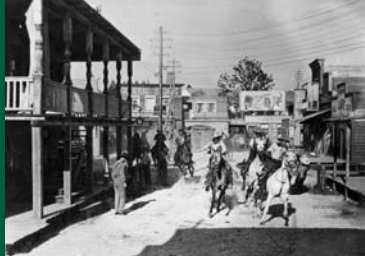
GOLD IN NEW FRISCO (DE 1939)